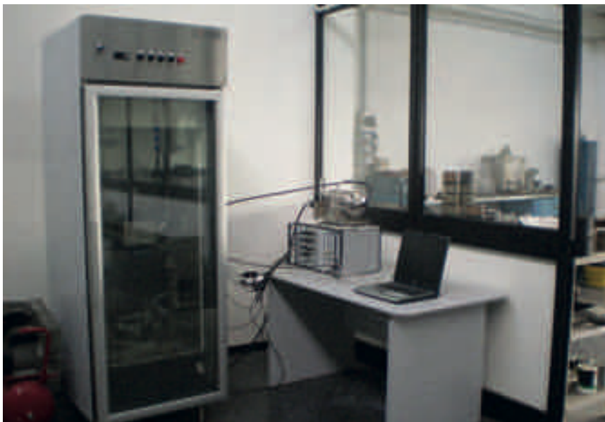
Attrezzatura per prova di modulo e prova di fatica (UNI EN 12697-26 e 12697-24)*