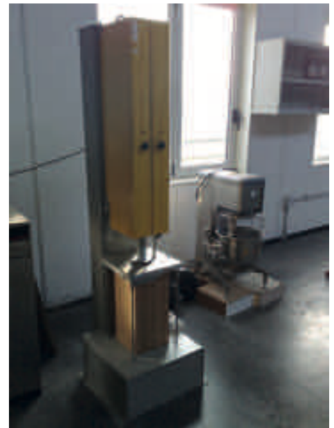
Compattatore Marshall a impatto (UNI EN 12697-30)