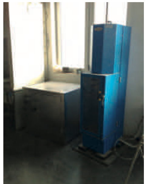
Costipatore per CBR (UNI EN 13286-47/08)*