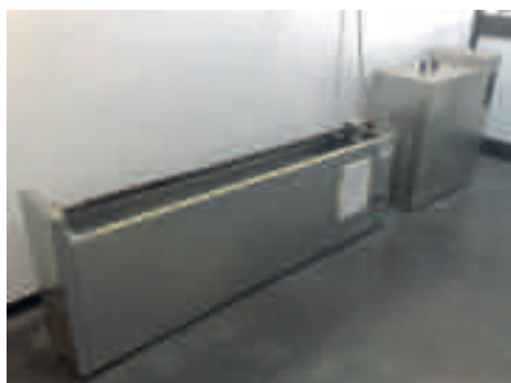
Ritorno elastico/duttilità (UNI EN 13398 e 1358*9)