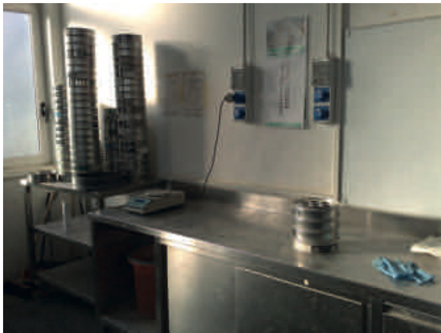
Spazio adibito a granulometrie