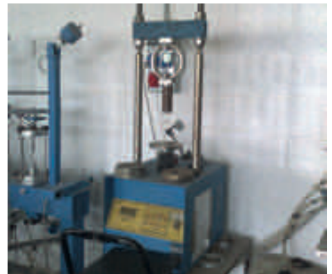
Pressa per rottura CBR (UNI EN 13286-47/08)*