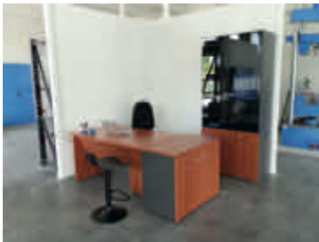
Accettazione campioni ed elaborazione dati