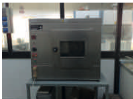
Invecchiamento RTFOT (UNI EN 12607-01)*