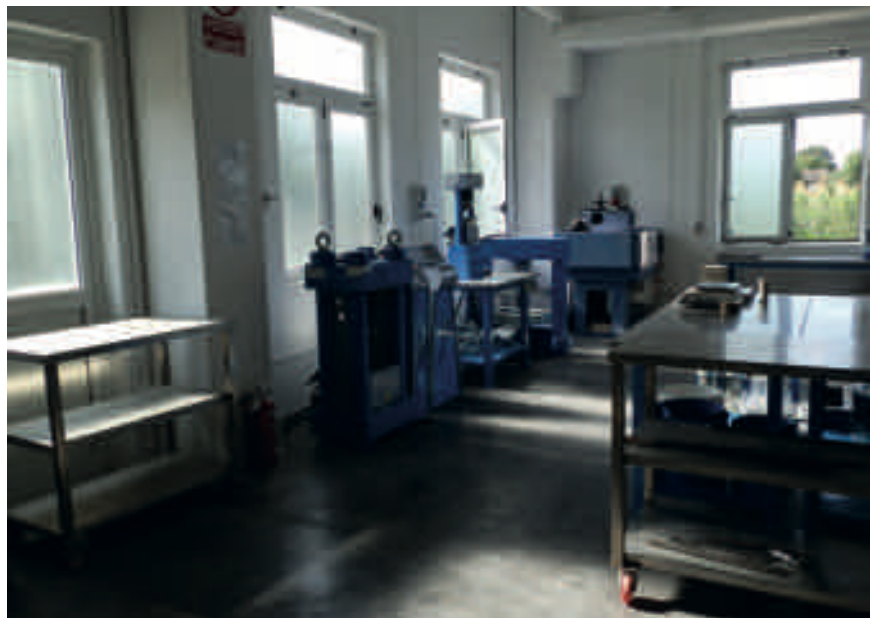
Presse per calcestruzzi