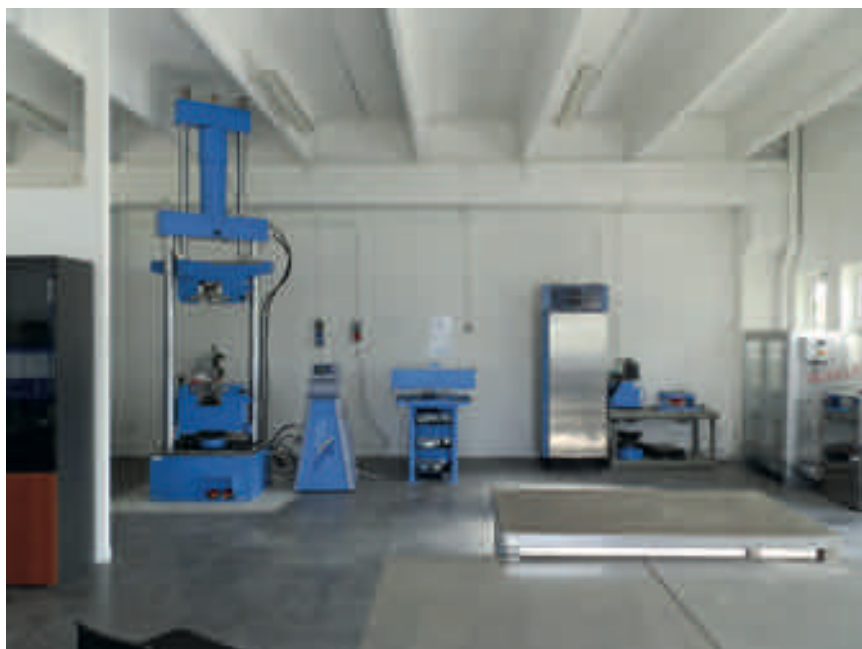
Trazione e piega su acciai