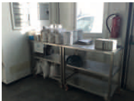
Spazio adibito all'accettazione dei campioni