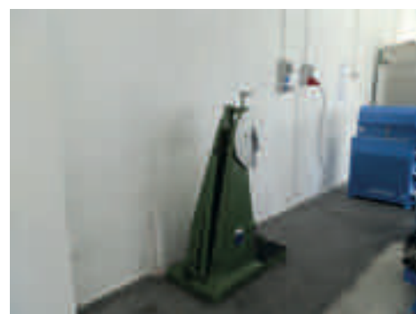
Pendolo di Charpy