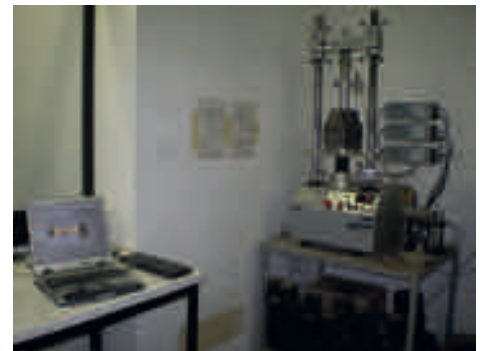
Pressa Marshall (UNI EN 12697-34)