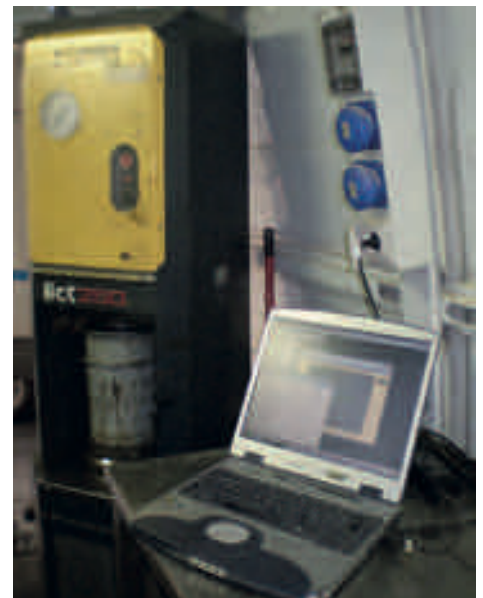
Pressa giratoria (UNI EN 12697-31)*