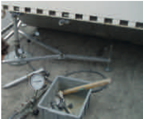
Prova di carico a doppio ciclo con piastra circolare diam. 300 mm. (CNR B.U. n. 146)