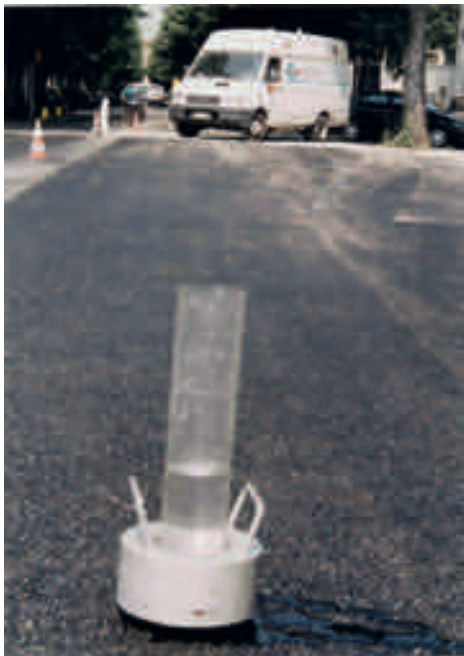
Permeabilità in situ con metodo Belga*