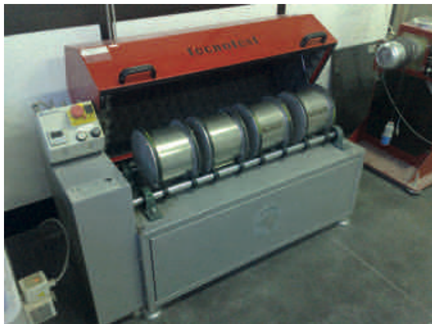
Determinazione della resistenza all'usura (Micro-deval) (UNI EN 1097-8:2001)*