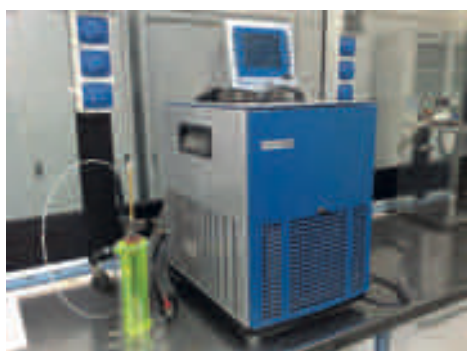
Apparecchiatura per rottura Fraass (UNI EN 12593)