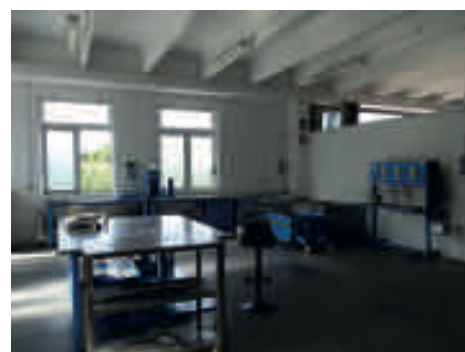
Maturazione e permeabilità calcestruzzo