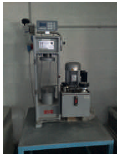
Pressa per misti cementati (CNR BU 29/72)*