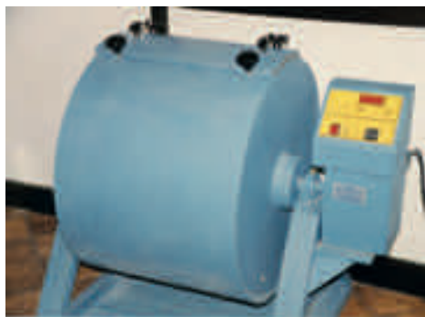
Los Angeles (CNR BU 34/73 - UNI EN 1097-2/08)