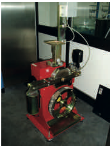
Coefficiente di levigabilità accelerata (UNI EN 1097-1:2004)*